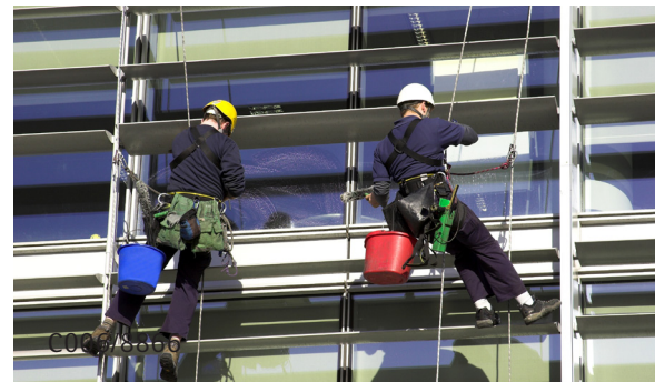
Léiríonn an pictiúr seo glantóirí le hardscileanna dreapadóireachta ar crochadh thar bruach leis na fuinneoga a ghlanadh le huisce sobalach agus le spúinsí

Ina theannta sin, tá foirgnimh ag éirí níos airde de réir a chéile agus úsáidtear gloine in áiteanna as cuimse. Is deacair an ghloine a bhaint amach agus bíonn sainghlantóirí tionsclaíocha de dhíth atá oílte ar dhreapadóireacht agus rópadóireacht anuas a dhéanamh. Is ard-riosca é do na glantóirí atá bainteach leis an obair seo, tá siad daor a fhostú, agus is féidir an drochaimsir bac a chur orthu.